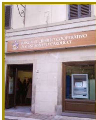
NELLA FOTO LA DICIESIMESIMA FILIALE DELLA BANCA INAUGURATA A CAMPIGLIA MARITTIMA, IL 10 GENNAIO SCORSO.