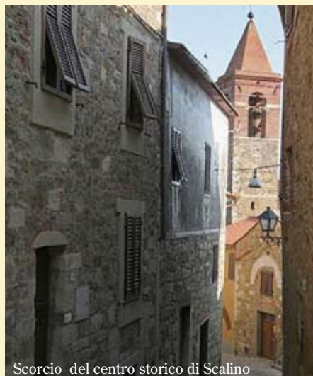
Scorcio del centro storico di Scarlino

Il giorno 21 novembre u.s. è stata inaugurata la 16° filiale della Banca, la seconda in Provincia di Grosseto, a Scarlino loc. Puntone Via delle Scuole. All'evento erano presenti, oltre ai rappresentanti aziendali ed ad un buon numero di dipendenti, il Sindaco di Scarlino ed i rappresentanti della stampa locale. Il nuovo insediamento è stato accolto favorevolmente dalla popolazione che ha partecipato durante tutta la mattina all'evento stesso.