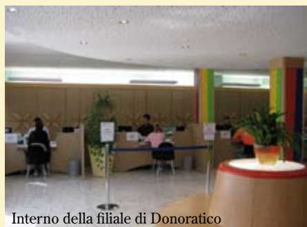
Interno della filiale di Donoratico

La nostra banca ha davvero dimostrato, fino ad ora in silenzio, un comportamento improntato alla massima correttezza nell'applicazione delle norme e nel sostegno alla clientela. La corretta applicazione delle nuove regole sul massimo scoperto ha infatti trovato applicazione già dal primo gennaio 2009 senza aver provveduto a "sostituire" con commissioni alternative la perdita di redditività. Una scelta senza dubbio costosa ma doverosa sostanzialmente per due motivi: aiutare le aziende in un periodo particolarmente difficile ed affermare concretamente la vicinanza di una banca locale alle realtà che vivono nel territorio di competenza.